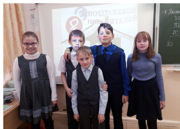
Команда 4 «б» класса «Биткоин» набрали 270 «монеточек». 2 место