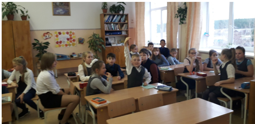
Ученики 4 «б» класса во время игры