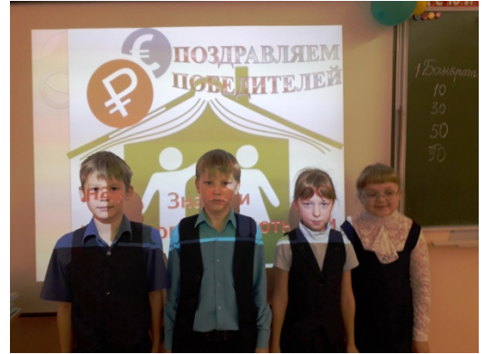
Команда 4 «а» класса набрали 170 «монеточек» . 3 место