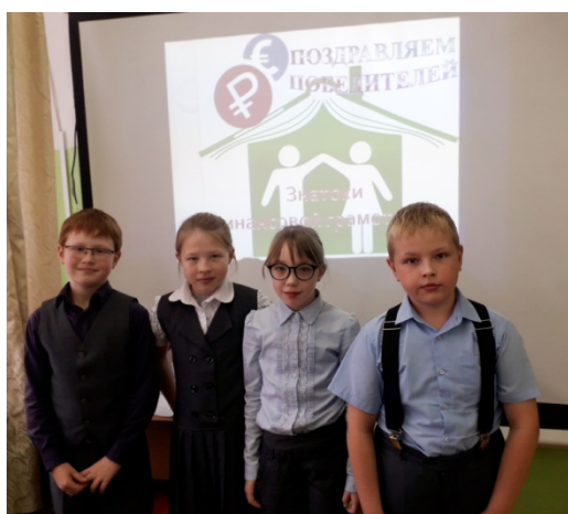
Команда 4 «в» класса «Богачи» – победители игры «Знатоки финансовой грамотности» Набрали 350 «монеточек»