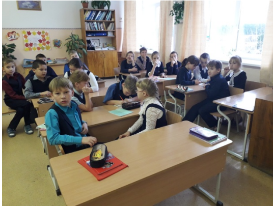
4 «а» класс во время игры