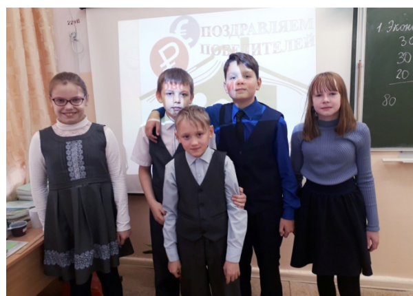
Команда 4 «б» класса «Биткоин» набрали 270 «монеточек». 2 место