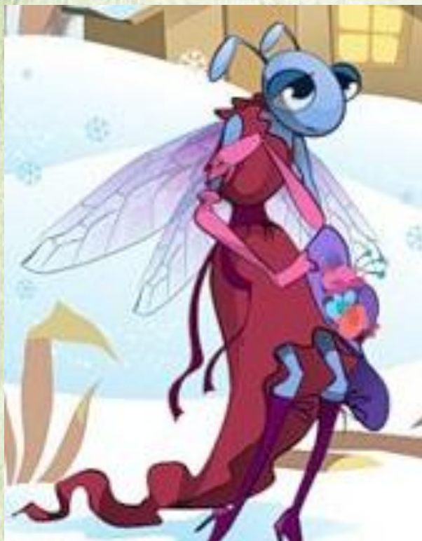
Мультфильм «Стрекоза и муравей». СССР, 1961 г.

Кредиты типа «Стрекоза» – позволяют получить удовольствие прямо сейчас: