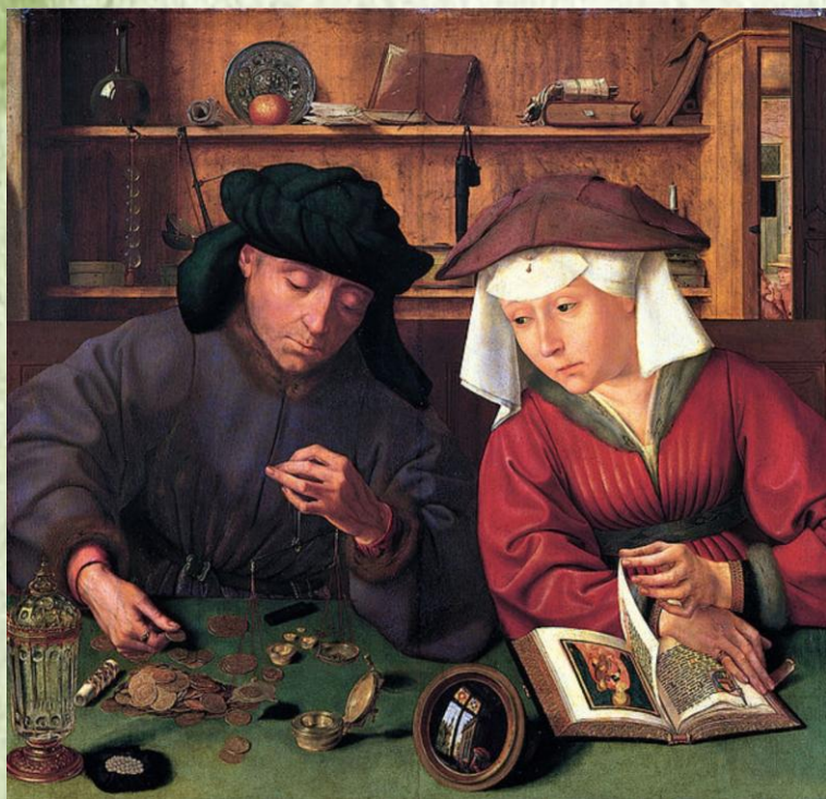
Меняла с женой Квентин Массейс, ок.1514г., Париж, Лувр