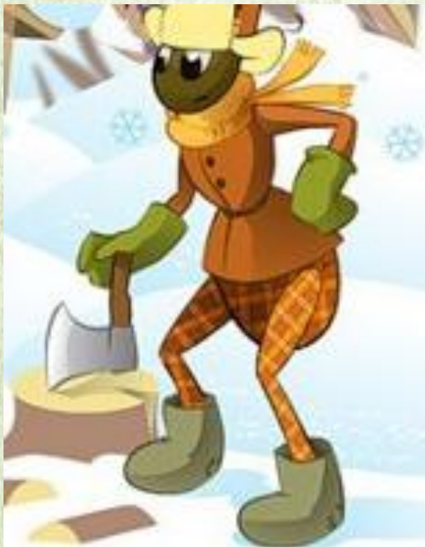
Мультфильм «Стрекоза и муравей». СССР, 1961 г.

Кредиты типа «Муравей» позволяют в будущем стать богаче: