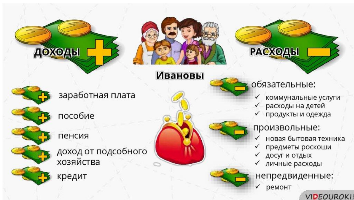
Иллюстрация «Семейный бюджет»

Наиболее важной функцией семьи является формирование и использование семейного бюджета. Бюджет семьи – это финансовый план семьи, представляющий собой роспись её доходов и расходов за определенный промежуток времени.