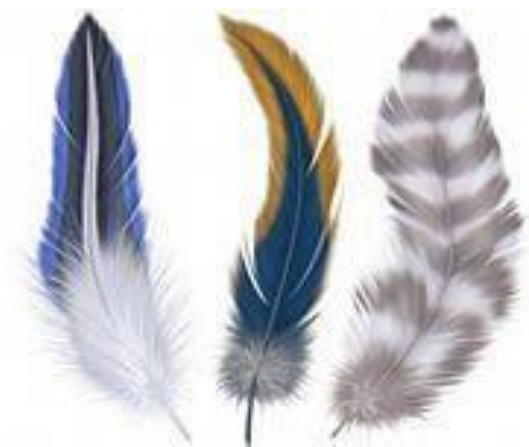
Перья редких птиц