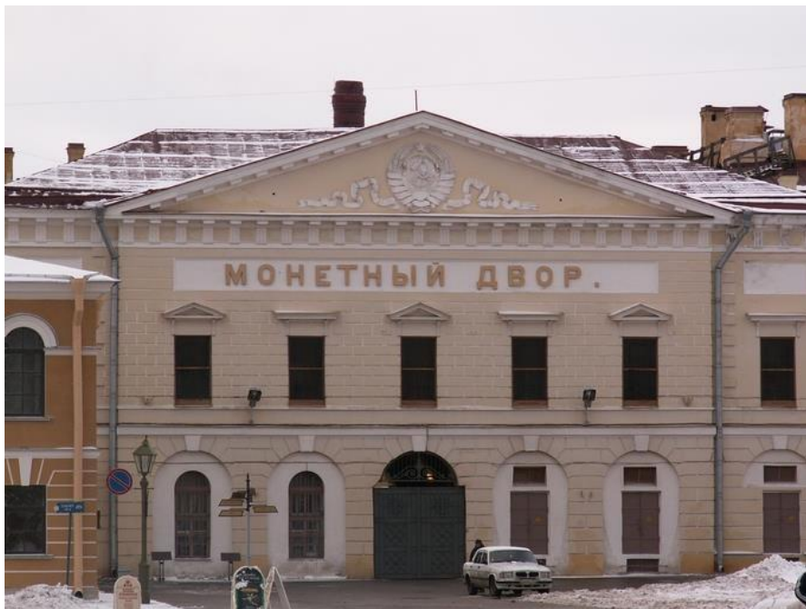
Санкт – петербургский монетный двор

Вот так чеканят и печатают современные деньги